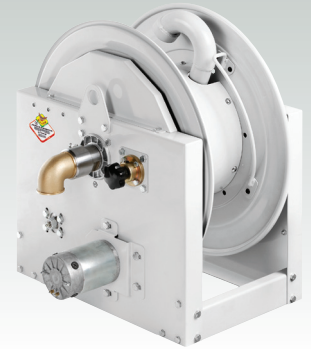
AVVOLGITUBO S.700 ELETTRICO 24 V

The S.700 electric 24V hose reels to be over available in 4 different widths (see note below) may fit different hose guide 6 ports by type and location of assembly (see specific spare parts jets hose guide)