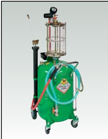
ASPIRATORE PNEUMATICO OLIO ESAUSTO DA 90 L CON PRECAMERA AIR-OPERATED WASTE OIL DRAINER 90 L TANK WITH PRECHAMBER